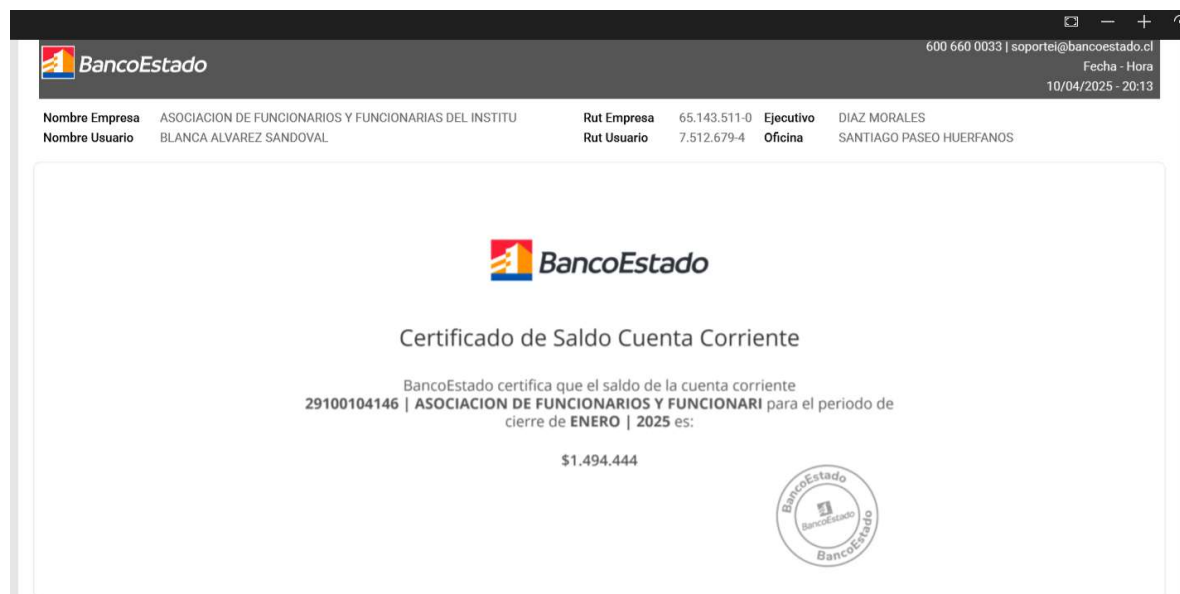
Imagen Cuenta corriente BancoEstado:

(Balance año 2024 en proceso de elaboración por Contador externo).